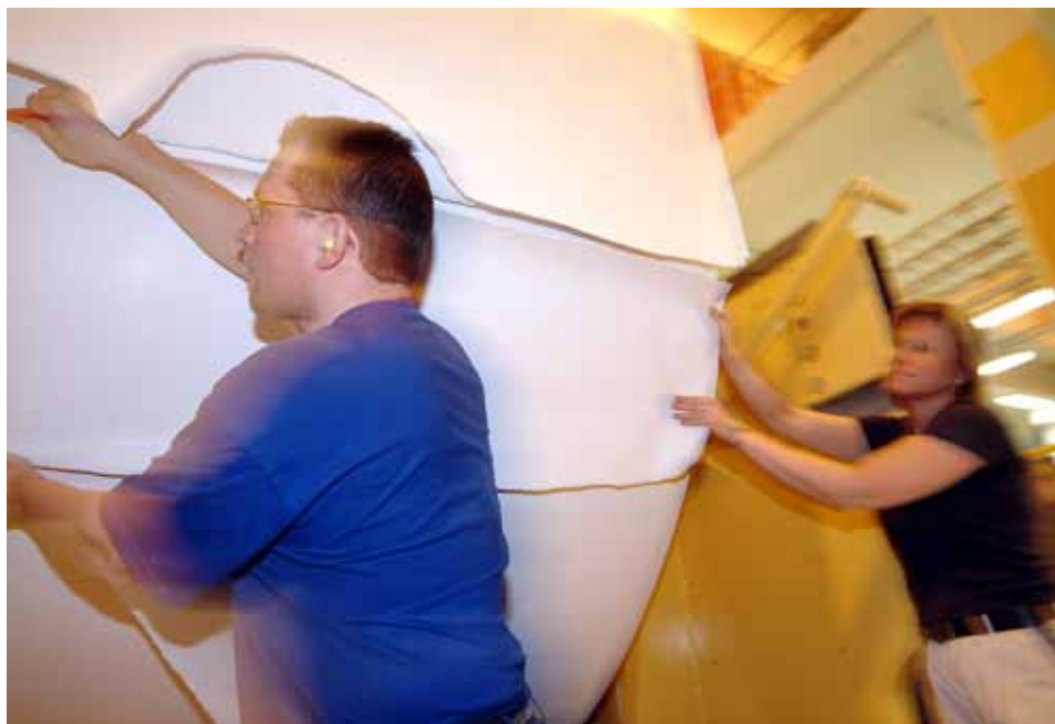
Arbetet i Sirius inriktar sig på att utveckla hälsa, säkerhet, kompetens, ledarskap och medarbetarskap.