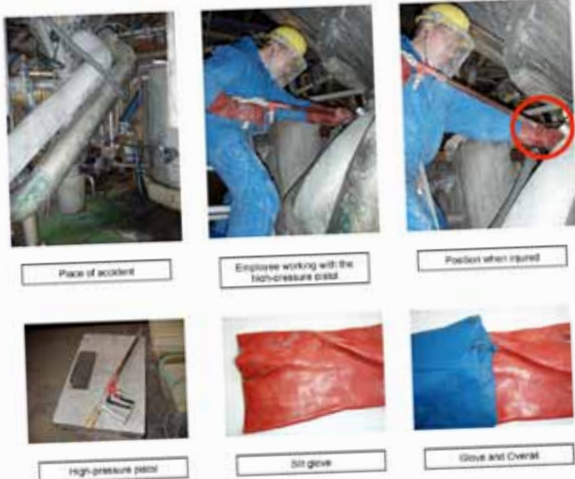
Place of accident